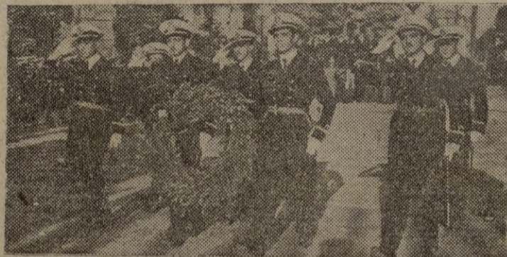
SEVILLA.—Con motivo de las fiestas del VII Centenario de la Marina de Castilla, las dotaciones de los barcos hispanoamericanos anclados en el Guadalquivir, depositan coronas de flores ante el monumento al rey San Fernando.