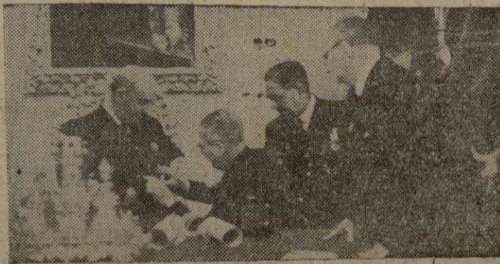
CADIZ.—Un momento del acto celebrado en la Diputación provincial durante el cual el Caudillo recibió la Medalla de Oro de la ciudad.