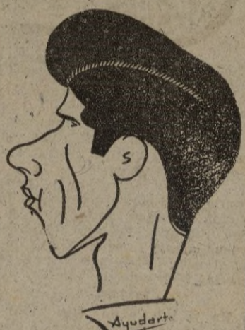
Martínez II, que vuelve por sus fueros de gran goleador. El domingo se anotó dos tantos en Córdoba

el partido tuvo casi siempre un dominio alterno, en los ataques ceuties no sólo se apreció una mejor penetración y fortaleza, sino que fueron infinitamente más audaces y peligrosos hasta el punto de que no hubiera extrañado un tanteo aún mayor a su favor.