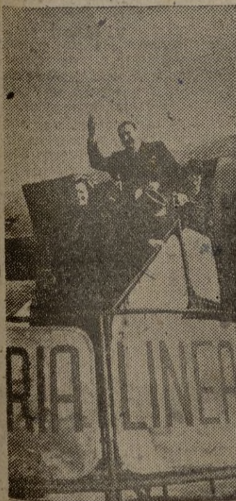
MADRID.—El Sr. Martín Añejo, después de su estancia en la Argentina, donde ha sido objeto de entusiasmadas muestras de afecto y simpatía, regresa a España. En la foto, momento de su llegada al aeródromo madrileño de Barajas.

Llegada a Madrid del Ministro de Asuntos Exteriores