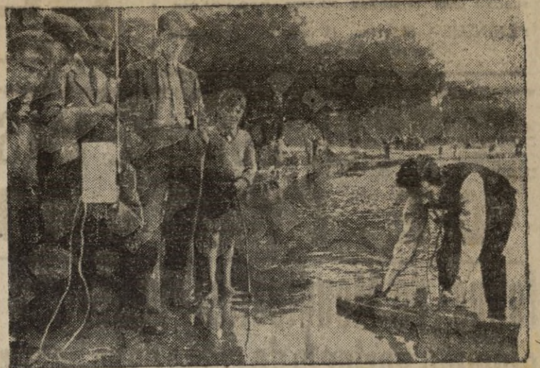
Eso que parece un juego, sin dejar de serlo es nada menos que un modelo de buque de guerra controlado por radio. Este invento se ha aplicado también a un modelo de aeroplano obteniéndose resultados satisfactorios a una distancia de 1.200 metros.—Calpe.