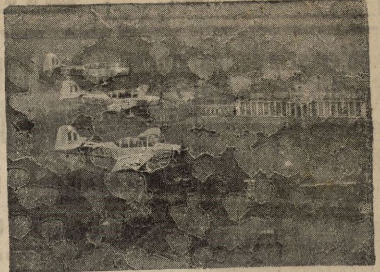
Los aeroplanos de entrenamiento "Prentich" efectúan una demostración en la Escuela que la R. A. F. tiene en Cramwell