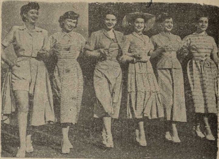
Los maniquies de Lancashire presentan en Londres las últimas creaciones de la industria algodonera de aquella región.—(Calpe).