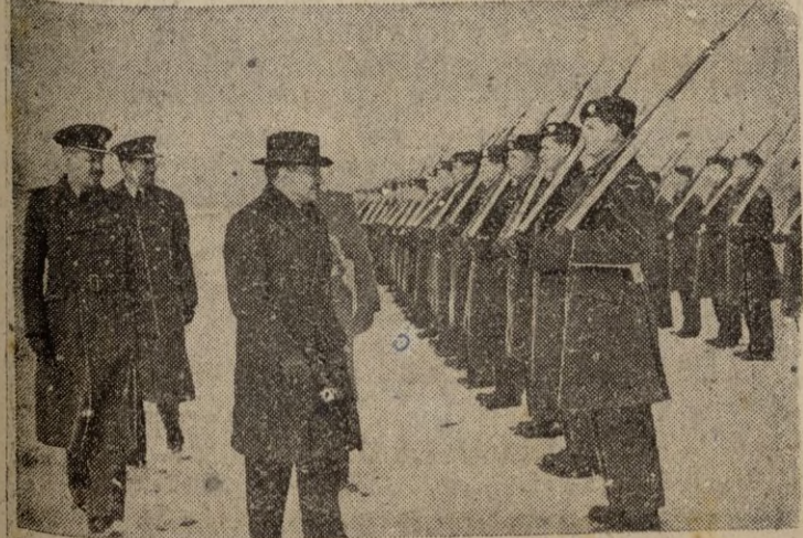
El primer ministro británico, Mr. Attlee revista las fuerzas de ocupación en el campo de aterrizaje de Guterdlch, (Alemania) durante la reciente visita que hizo a la capital alemana.