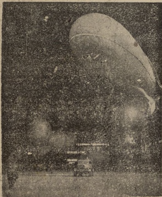
Los globos que sirvieron para evitar ataques aéreos durante la guerra, son utilizados en Inglaterra para preparación del personal de paracaidistas, enfermeras de Aviación, etc.

Grandes cantidades están dedicadas a la Aviación naval, tanto para la defensa de los convoyes, como para la acción ofensiva de los portaviones sobre territorio enemigo. Contamos once portaviones, con seis más en construcción. Un portaviones quedará completamente modernizado. La paga del marino quedó aumentada el año último, y en varios conceptos. Los cuartos de baños y las galerías han sido objeto de gran modernización. Los barcos llevan refrigeradores automáticos, panaderías mecánicas y una serie de dispositivos que economizan tiempo y esfuerzo, tales como máquinas para pintar. Mr. Dugdale, finalmente, señaló cómo se otorgaban nuevas facilidades para el ascenso de los rangos inferiores.—(Servicio especial).