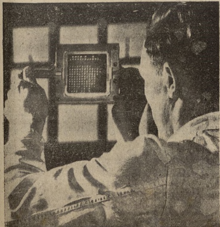
Para el estudio de bacilos, en la China se emplea aparte del microscopio, éste original sistema que admira un estudiante sueco

Weil sugiere que el túnel bajo el Canal se hará en forma cooperativa por todas las naciones de Europa Occidental. Pide también que se construya el túnel por debajo del Estrecho de Gibraltar para incrementar la economía y la defensa de Europa, añadiendo una ruta de carreteras y ferrocarriles que unan los dos continentes.—Efe.