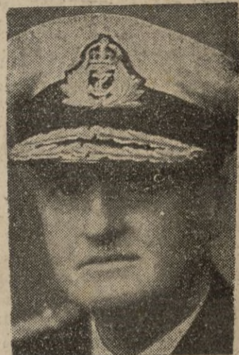
Lord Fraser, almirante jefe de la Escuadra británica.

«La batalla no ha terminado» declara el almirante de la Flota, Lord Fraser