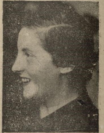
menina en Vizcaya. Proyecta ir a la región una semana.

Bilbao, 20.—Ha llegado, procedente de Madrid, la delegada nacional de la Sección Femenina, Pilar Primo de Rivera, quien seguidamente se trasladó a la capilla José Antonio, de la Jefatura provincial del Movimiento donde, como todos los días 20 de cada mes se ha celebrado una misa por el alma del Fundador de la Falange. Luego marchó a los locales de la Delegación provincial de la Sección Femenina y acompañada de las jerarquías provinciales efectuó a inspección que motiva su viaje. Más tarde saludó al gobernador civil y jefe provincial del Movimiento y luego marchó al Preventorio "José Antonio" de Gallarta, en plena zona minera, en el que permanecerá hoy y mañana para continuar más tarde sus visitas de inspección a todos los servicios de la Sección Fe-