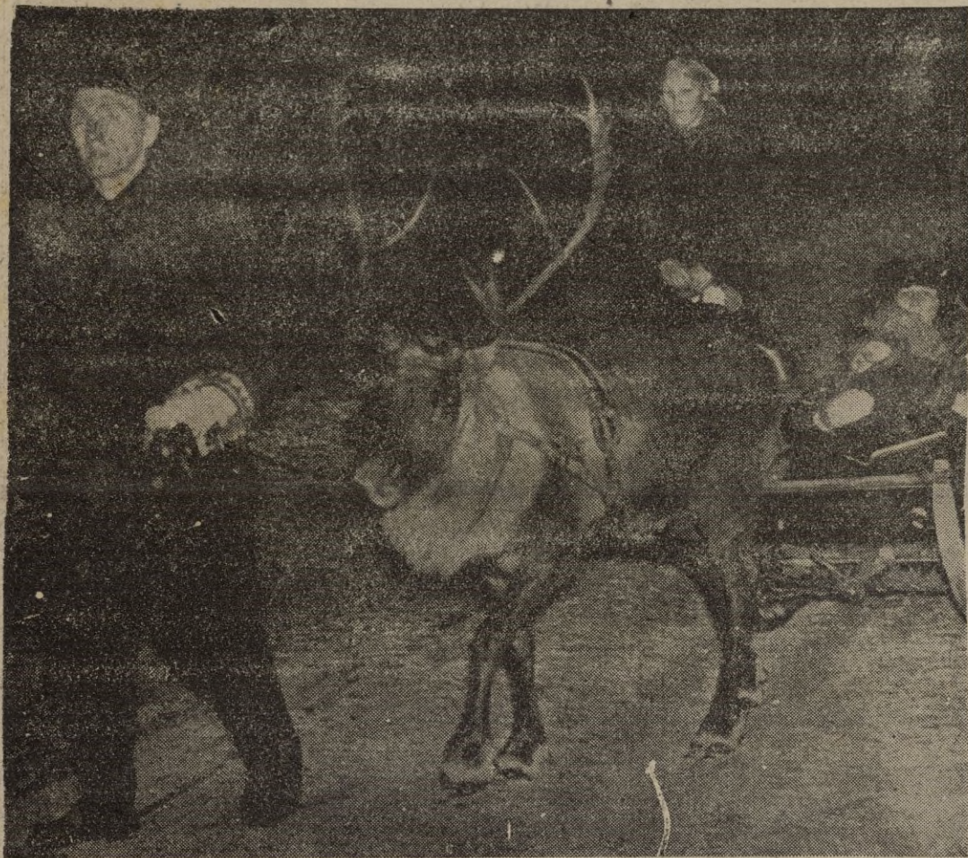
Al igual que estos infelices campesinos de Tervola, son muchos los rusos que emigran buscando la llegada a las zonas occidentales

«En cualquier parte de América, con un poco de tierra y una mula, viviríamos tranquilos», dicen los comunistas desertores