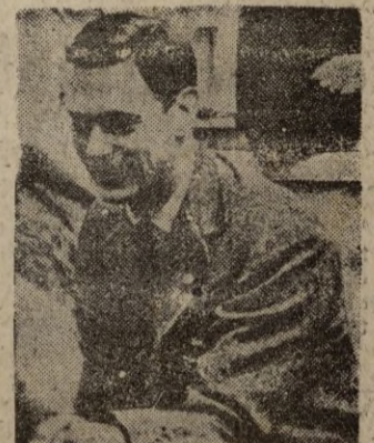
El día parecía estar satisfecho de los resultados de la conferencia, que será anunciados hoy.—EFE.