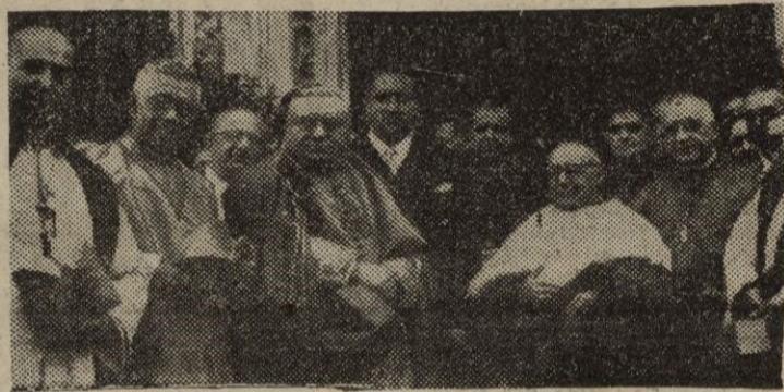
Solemne Pontifical en homenaje a la Virgen de Guadalupe

MADRID.—El Cardenal primado de España, Dr. Plá y Deniel, con el ministro de Asuntos Exteriores, Sr. Martín Artaño; el arzobispo de Méjico y demás autoridades eclesiásticas de ambos países, a la salida de la iglesia de los Jerónimos después de celebrado el solemne pontifical en homenaje a la Virgen de Guadalupe.