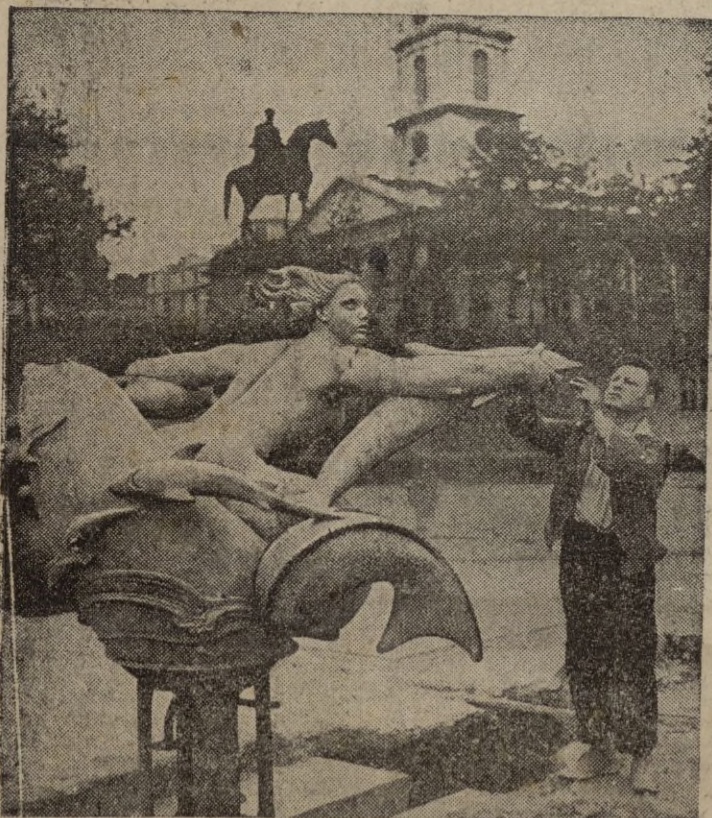
La entrada al Museo de Londres, ofrece maravillosas perspectivas. He aquí a uno de los empleados, dando los últimos toques a una figura decorativa

Elaborada por ROMA. - Cervantes, 8. - Telf. 889