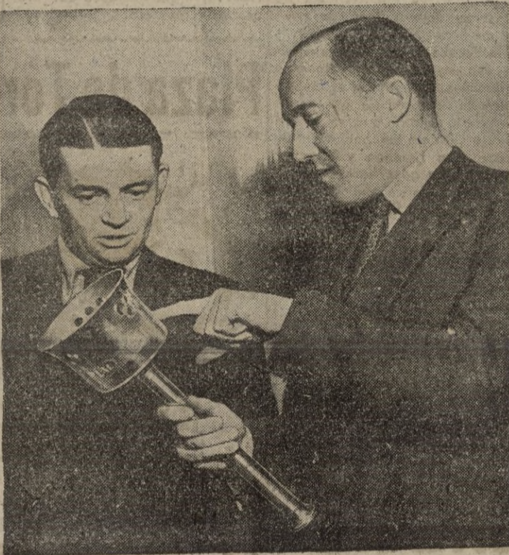
Matr Busby, católico y gran impulsor del Deporte en Inglaterra, recibe la antorcha de los Juegos Olímpicos.

se preocupan de mantener la camaradería deportiva que hace factible una extraordinaria compenetración deportiva y social. Matt Busby y otros colegas se han preocupado este año de inaugurar una serie de partidos internacionales entre los escolares católicos británicos y los de Francia y Bélgica, a los que el Cardenal Griffin ha dado su bendición y apoyo. Como Su Santidad el Papa ha manifestado, la camaradería en el deporte facilita la unidad entre los pueblos sobre una base común, y es de esa camaradería de donde mejor puede nacer el entendimiento entre las naciones.—(Servicio especial).