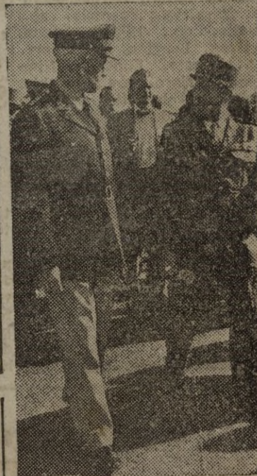
PARIS. — Procedentes de Londres, los jefes de Estado Mayor norteamericanos, llegaron el pasado día 4 al aeródromo de Orly para ultimar sus conversaciones sobre la defensa de Europa occidental. En la foto aparece el general Omar Bradley conversando con el jefe del Estado Mayor francés, general Georges Revers.

También Radio Moscú habla de cuantiosas bajas de los leales. En los círculos griegos de Londres se hace resaltar que no es ésta la primera vez que Albania lanza la acusación —falsa— de violación en gran escala de su territorio por los gubernamentales helénicos.—EFE.