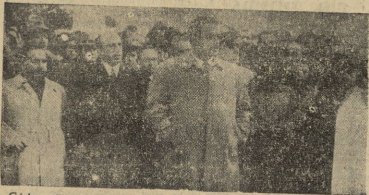
Cádiz.—El ministro de Trabajo, señor Girón, durante la ceremonia de entrega de viviendas en el barrio de «La Plata».