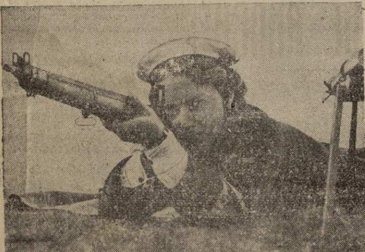
El Cuerpo auxiliar femenino británico realiza ejercicios para la defensa metropolitana. He aquí una muchacha ejercitando su puntería.