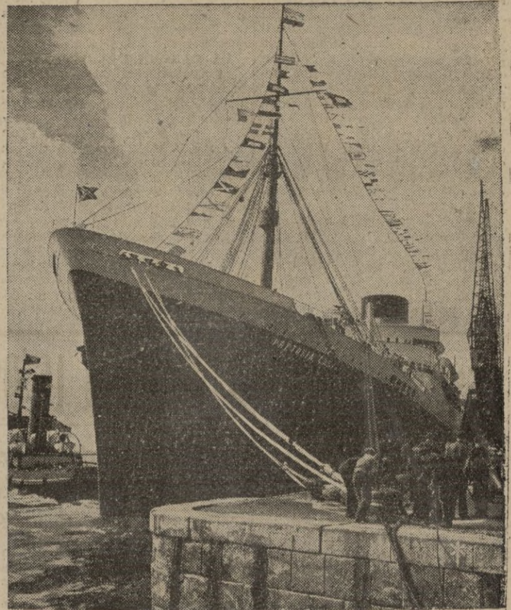
El trasatlántico «Pretoria Castle», propulsado por tubo-motores, de 28.705 toneladas, antes de emprender su primer viaje de Southampton a Africa del Sur. —(Calpe).