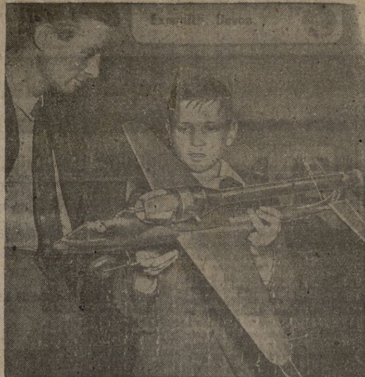
En todos los países se dedica gran atención a las enseñanzas aéreas. En Inglaterra hay escuelas de aeromodelismo. Aquí vemos a un muchacho explicando las características de un aparato construido en la Escuela. — Calpe.