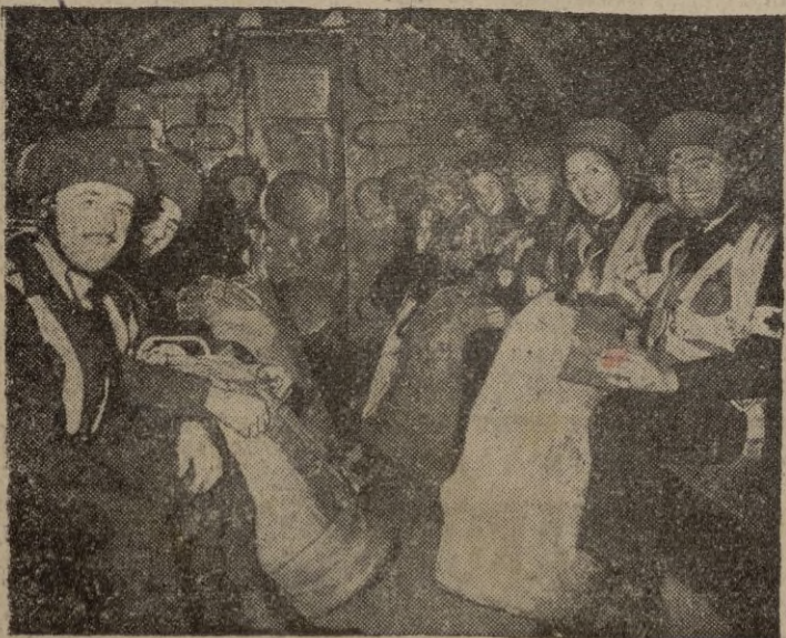
Elmeras paracaidistas de la RAF a bordo de un aparato destinado a su entrenamiento. — (Calpe)