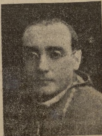
(Pasa a la página 6).

Bajo el régimen de Franco se ha restablecido la paz y el orden —añade el Primado— y creo