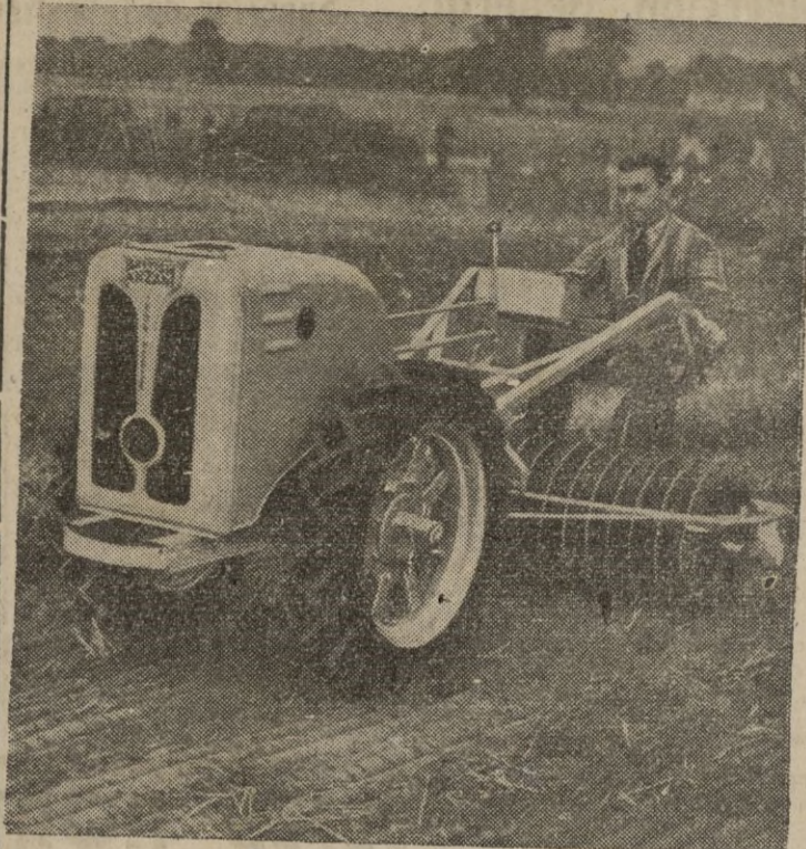
Tractor de seis caballos de fuerza y dos ruedas solamente, de gran éxito en los pequeños cultivos por su economía y eficiencia.— Calpe.