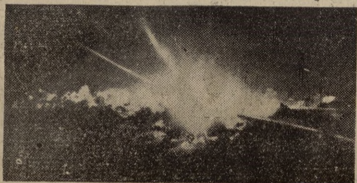
La primera fotografía obtenida de la explosión de la bomba atómica que produjo un cráter de 23 metros en el fondo del mar

de cadena y se desintegran millones en la fracción de un segundo, para un trozo de Uranio 235 contra otro dentro de la bomba. Cuando están separados, ninguno de