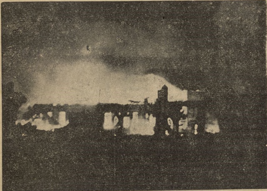
Después de un bombardeo, así quedó el ala sur del Convento. Las llamas consumieron toda esta parte.

Ocurrió cuando la tribu salvaje de Pathan rechazó a las rehas de la India, en Baramullah, Cachemira. El convento