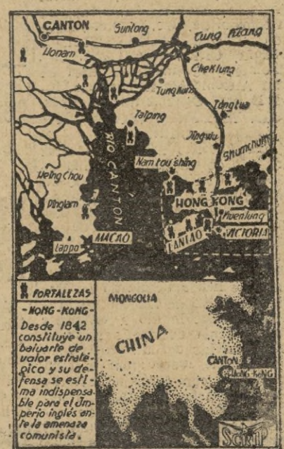
PORTALEZAS HONG-KONG Desde 1842 constituye un baluarte de valor estratégico y su defensa es esencial para el Imperio inglés ante la amenaza comunista.

La base militar de Hong-Kong tiene una disposición bélica análoga a la de Gibraltar y está considerada como privilegiada atalaya de Singapur y de todo el resto de la China. La isla es un macizo montañoso de 85 kilómetros cuadrados de extensión con una cota máxima de 560 metros, a cuyos pies descansa la ciudad de Victoria con medio millón de habitantes y considerada como capital del territorio. Frente a Victoria, al otro lado del canal y ya en suelo continental, se halla Kowloon, península que se alarga en el mar con su medio centenar de kilómetros con instalaciones portuarias de todo orden. Hong Kong es en la actualidad, el único territorio chino continental que podría conservarse para futuras negociaciones con el gobierno chino que resultase vencedor en la contienda presente y que se dibuja ya con toda nitidez. Pero no se olvide que Hong Kong es, y será siempre una parte de China un 95 por 100 de población de color en un total de 2 millones de almas. Y esa gran mayoría no dejó nunca de pensar en la vuelta del territorio bajo mando chino, sin mencionar demasiado las ideologías.