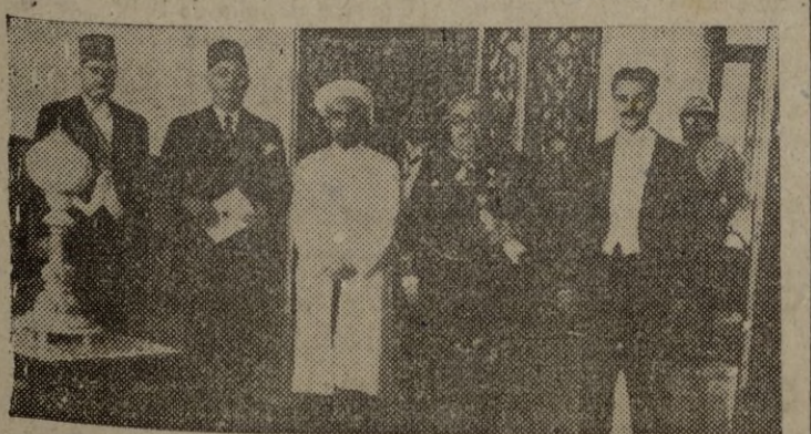
AMMAN.— El nuevo Ministro de España en Transjordania, don Gonzalo Dieguez Redondo, acompañado del Rey Abdullah y de su ministro de Asuntos Exteriores, en el acto de presentación de cartas credenciales del representante español.