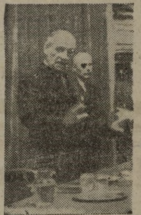
son Wilder, escritor y autor teatral que ha obtenido tres veces el premio nacional.—Efe.

Mientras, al borde del pétreo lecho, por donde fluye con la hermosura de una tragedia griega, el viscoso río que calcina árboles, sepulta casas y camina hacia la muerte, sembrando la ruina y la desolación, tratamos de eludir el amargo pensamiento que nace de la contemplación del bello y horrible espectáculo. Arriba en la cumbre, el volcán se rodea de los más densos y oscuros penachos, como si tratara también de colocar ante su rostro imposible de piedra, una venda para no asistir a su propia agonía, a esa lenta hemorragia que lo va desgranando fantásticamente —Cifra.