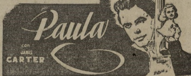
Una película "Columbia" de Richar WALLACE