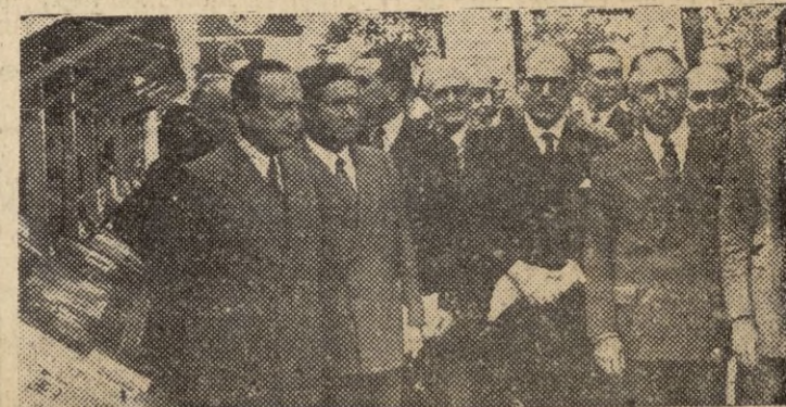
MADRID.— En el paseo de la Castellana, ha sido inaugurada la VI Feria Nacional del Libro, organizada por el Instituto Nacional del Libro Español, asistiendo al acto los ministros de Educación Nacional, Justicia y Aire. La integran 93 casetas y participan en ella la Argentina y Portugal.