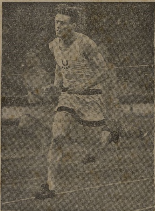
La belleza y emoción del pedestrimo queda reflejada en este instante de la llegada, en el que el interés y el esfuerzo pueden más que el cansancio y el agotamiento.

Calle Generalísimo Franco (es tática de González Tablas) desde donde se dará la salida oficial, calle Edrisis, Puente del Cristo, Avenida González Tablas, Avenida de Africa, Cruce del Morro, Almadraba, Carretera Nueva, Puente de Nuestra Sra. de Africa calle Independencia, Paseo Colon, calle Santander, Recinto Sur, Escuelas Prácticas, Carretera del