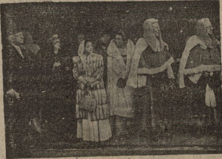
Inglaterra conserva celosamente sus tradiciones. En esta curiosa foto vemos a diversas personalidades, ataviadas con trajes de ceremonia, esperando sus coches a la salida del Parlamento, después de asistir a un solemne acto.