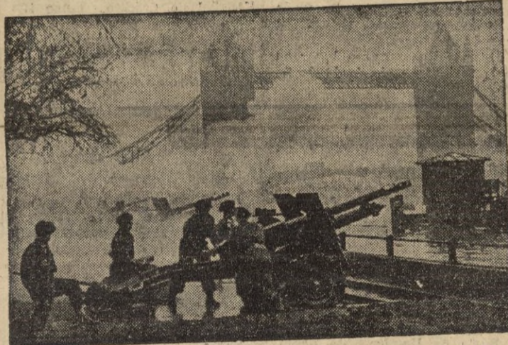
Esta escena, que nos recuerda otras no muy lejanas, no tiene sin embargo carácter bélico. Es la foto de un suceso memorable para los británicos, que ahora nos llega y que nunca pierde actualidad. Piezas de artillería emplazadas junto al puente de la Torre de Londres, disparan las salvas de ordenanza con motivo del nacimiento del hijo de la princesa Isabel y del duque de Edimburgo.