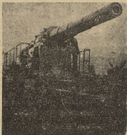
Pieza de artillería del calibre 34'5 cm. que defiende al atolón.

Recordamos con relación a esto, que los americanos edificaron el año pasado en la isla de Oahu, Centro Administrativo, Militar y Naval del archipiélago de las Hawaii, un gigantesco depósito de gaso-