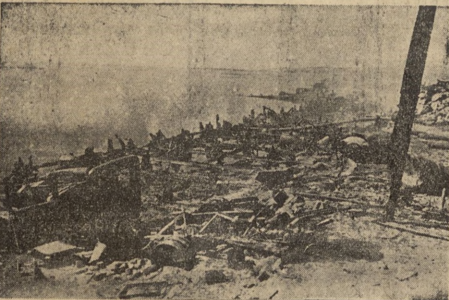
Cuando en 1447 un ciclón barrió el atolón de Palmyra, su pequeña plaza presentaba este terrible aspecto.

ción naval por espacio de seis años. Cuando se organizaron las líneas aéreas transpacificas entre las Hawaii y Nueva Zelanda, via Islas Samoa, se pensó en establecer en Palmyra un punto de escala, a la que luego se renunció, ignorándose por qué motivo, aunque este atolón se encontrará casi exactamente en la diagonal Honolulu-Apia.