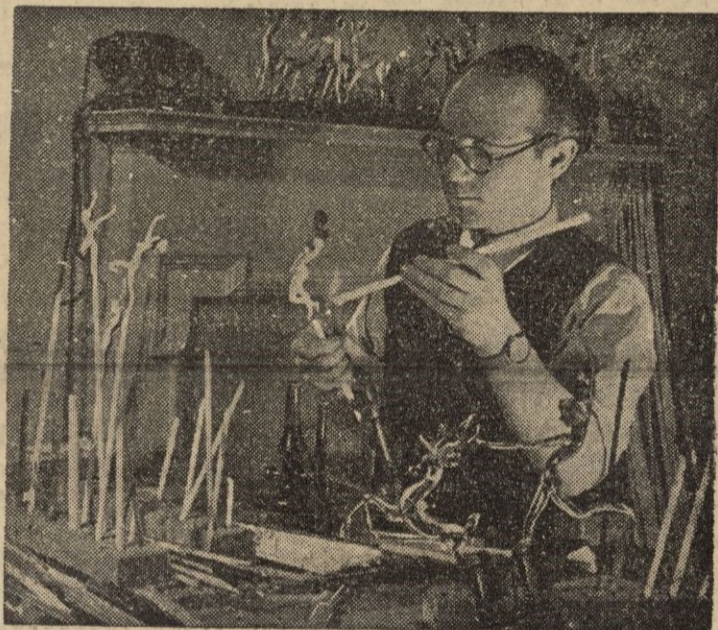
La industria británica cuenta con excelentes artesanos. Aquí vemos uno decorando figuras que serán presentadas en la próxima Feria de Industrias londinenses (Calpe)