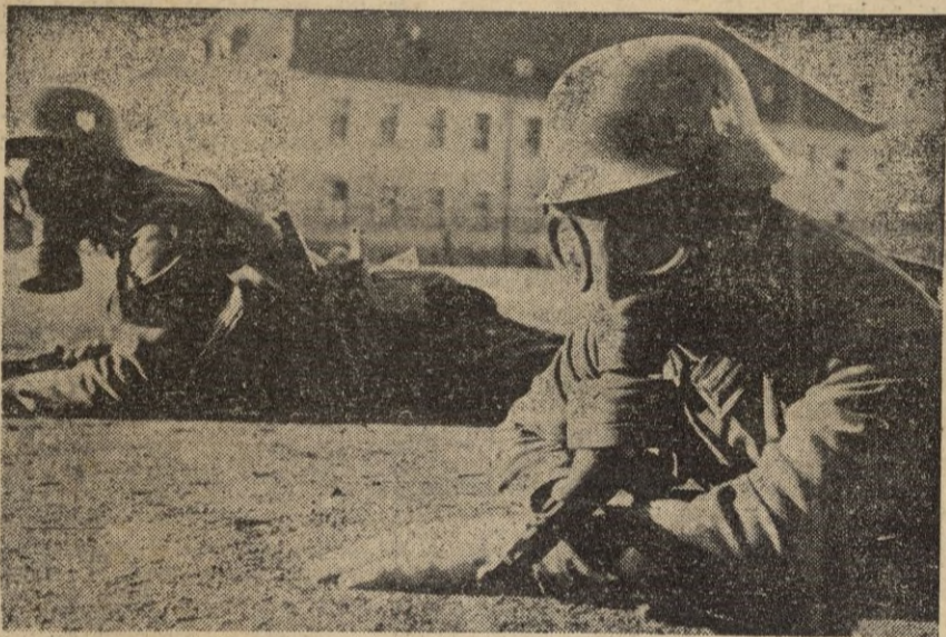
De nada servirán ya las máscaras de gas.

manicomio, hasta ahora no ha sido probado más que sobre rebaños de carneros. Los que han disecado el cuerpo de estos animales, se han quedado estupefactos al comprobar que el veneno ha desintegrado por completo los motores del cerebro provocando de este modo una locura furiosa. Durante unas horas, inmediatamente después de la absorción del Tabun, la persona gasificada ignora por completo que lo ha sido, ya que no hay nada en el mando