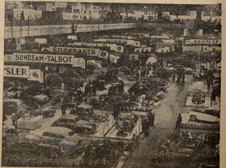
Una vista de la Exposición internacional de automóviles celebrada en Londres por primera vez desde 1938.