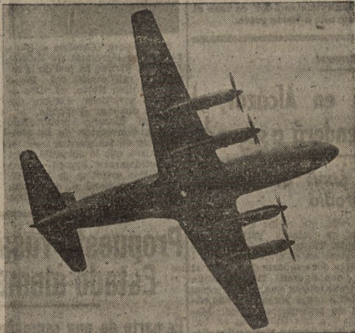
Ya está en servicio el primer avión de línea con tubopropulsión. Es el Vickers "Viscount", que puede transportar 32 pasajeros con las máximas comodidades.