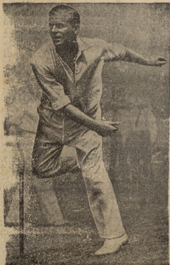
El duque de Edimburgo, que inauguró la exposición.

La Exposición se ha visto desde los primeros días concurrendísima; el público lo constituía especialmente por profesionales de la Marina y de la Aviación, que comentaron las características de los modernos instrumentos al par que las contrastaban con los de remotas épocas.—