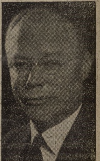
El presidente del Comité de Relaciones Exteriores, Tom Cunnally, manifestó que tal reducción amenazaría gravemente la continuación de los embarques de ayuda a Europa.

Otros senadores republicanos han sugerido que el Departa-