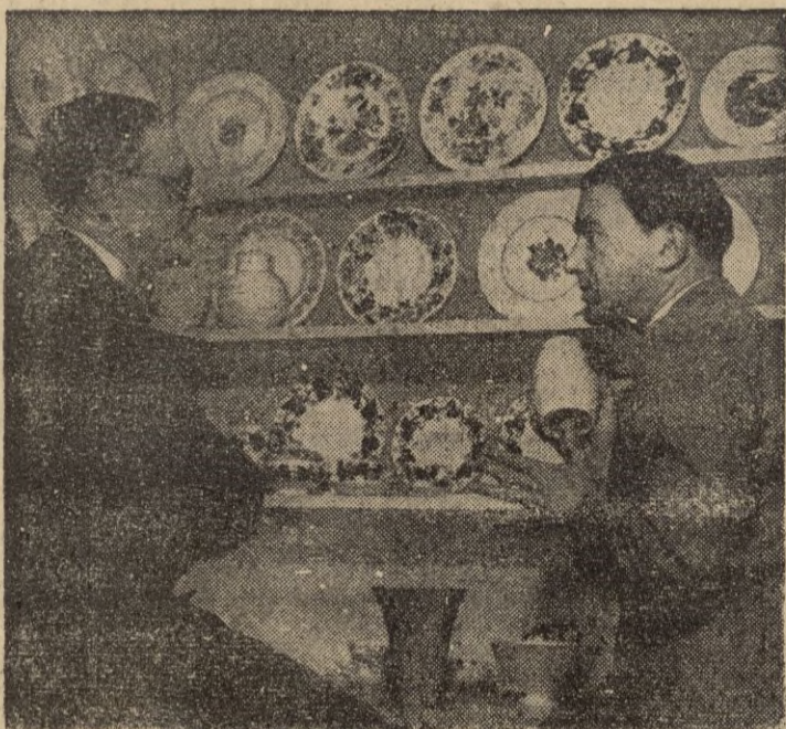
La juventud que recibe atenciones en los orfanatos creados por Monseñor, trabaja continuamente. He aquí una exposición de artesanía realizada en el orfanato de Liverpool.

Su celo desinteresado y su compenetración con la gente pobre le granjearon el respeto y la admiración de sus conciudadanos, que le conceptuaron siempre como un gran hombre. En el año 1903 marchó en misión especial al Canadá y Estados Unidos para estudiar la situación de los inmigrantes en aquellos países, y a su regreso recibió el homenaje de la población de Liverpool en un acto social al que acudió lo más destacado de la sociedad de esta capital. Fué en esta ocasión cuando se decidió erigirle una estatua por su ciudadanía ejemplar. Murió a principios de 1905. Su espíritu de trabajo perduró; Liverpool crece hasta el punto de tener hoy más de dos millones trescientos mil habitantes, de los que medio millón son católicos. La confraternidad entre los credos católicos y anglicanos continúa como siempre. Recuérdase que cuando se proyectó la Catedral anglicana, los planos fueron realizados por un arquitecto católico: Giles Scott; y ocurrió lo mismo con la Catedral católica, de cuya construcción se encargó un arquitecto anglicano: Luytens. Estos edificios son hoy símbolo del esfuerzo colectivo que la estatua de Monseñor rememora. (Servicio especial).