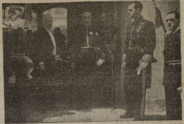
El Pardo. — Su Excelencia el Jefe del Estado, ha recibido al nuevo ministro de El Líbano en España, Amed Bey Baouk, que acudió al Palacio de El Pardo a efectuar la presentación de sus cartas credenciales. En la foto, vemos al ministro libanés a la salida del Palacio del Caudillo acompañado del primer-introducción de Embajadores, barón de las Torres.