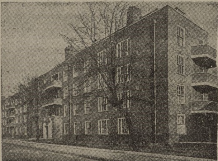
Grupo de viviendas como éste son los construidos por el celoso Obispo para las clases humildes. Todas las casas están dotadas de comodidades e higiene.

Este año de 1949, el mismo sacerdote ha celebrado las bodas de plata como Obispo y es Auxiliar de la Diócesis de Southward, en la misma parroquia, que jamás ha abandonado. La parroquia se ha convertido en una de las más grandes y activas comunida-