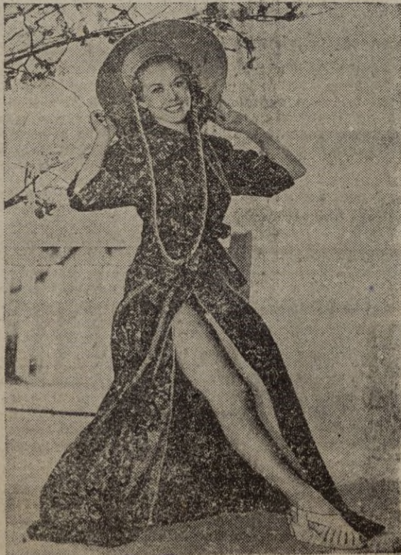
He aquí lo que pudieran ser modelos para este original sistema