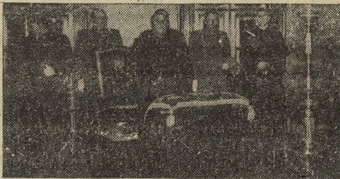
S. E. el jefe del Estado presidiendo los funerales que en el Monasterio de El Escorial se celebraron por el alma de José Antonio Primo de Rivera.