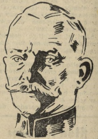
ción desfilando representaciones de todo el país.

El Jefe del Estado portugués fué felicitado por todo el Cuerpo Diplomático y el Dr. Oliveria Salazar, con el Gobierno en pleno expresó al mariscal Carmona su felicitación y la adhesión al efecto que por él sienten. Después se celebró una gran recep-