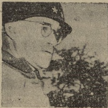
Montgomery (Alabama), 26.—El general Omar Bradley,