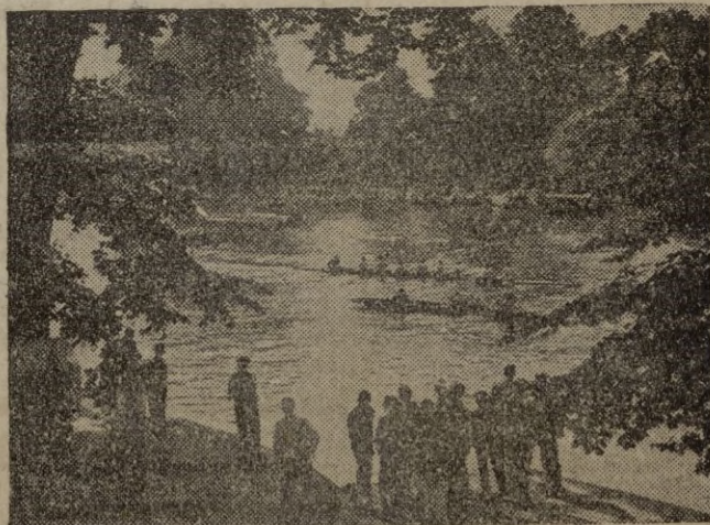
En uno de los ambientes más hermosos de Inglaterra, se ha celebrado la regata de Marlow, que debe su nombre a una pintoresca población situada junto al Támesis. (Calpe).