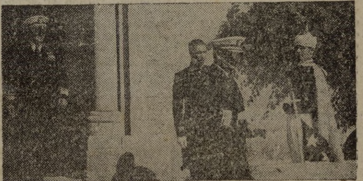
LA CORUNA.—Los jefes de la flota norteamericana llegada a España, almirantes Connolly y Henderson, salen del Pazo de Meiras, donde cumplieron a S. E. el jefe del Estado español.