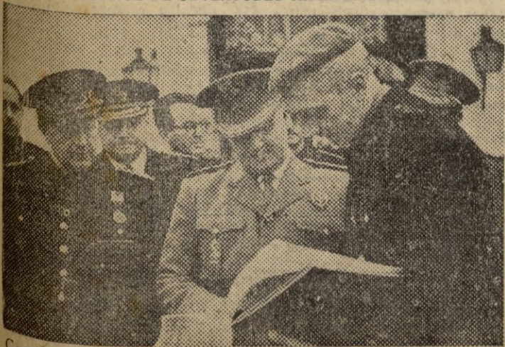
Con motivo del X aniversario de su fundación, el Frente de Juventudes ha rendido un homenaje al Caudillo de España tras de haber finalizado en Arenys de Mar su IX Consejo Nacional. Asistieron al acto más de trescientos muchachos de las Falanges juveniles de Franco y otros doscientos jefes de Falange de los campamentos «Santa María» y «Sancho el Fuerte».