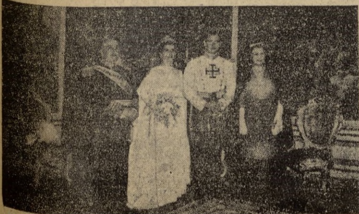
La Sta. Carmen Franco Polo, hija de Su Excelencia el Jefe del Estado, ha contraído matrimonio el lunes pasado con don Cristóbal Bordiu, marqués de Villaverde. Los contrayentes fueron apadrinados por el Caudillo y la condesa de Argillo madre del novio. Efectuaron su enlace en una ceremonia sencilla verificada en la capilla del Palacio del El Pardo