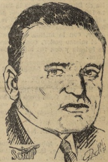
Aklilou Abte Wold

La oposición más fuerte que tienen los italianos en Abisinia es concretamente la del emperador de Etiopia, quien por boca de Aklilou Abte Wold, ha protestado en París, como antes en la ONU de la cesión de la administración de Somalia al Gobierno de Roma. El emperador Selasie se fundamenta entre otras razones, en que la vuelta a Somalia de los soldados italianos es opuesto a la voluntad mayoritaria del país, lo que puede provocar graves incidentes que alteren la paz de la región. Pero los italianos no lo ven así y se disponen a reforzar sus efectivos con nuevos contingentes de tropas en Mogadiscio.