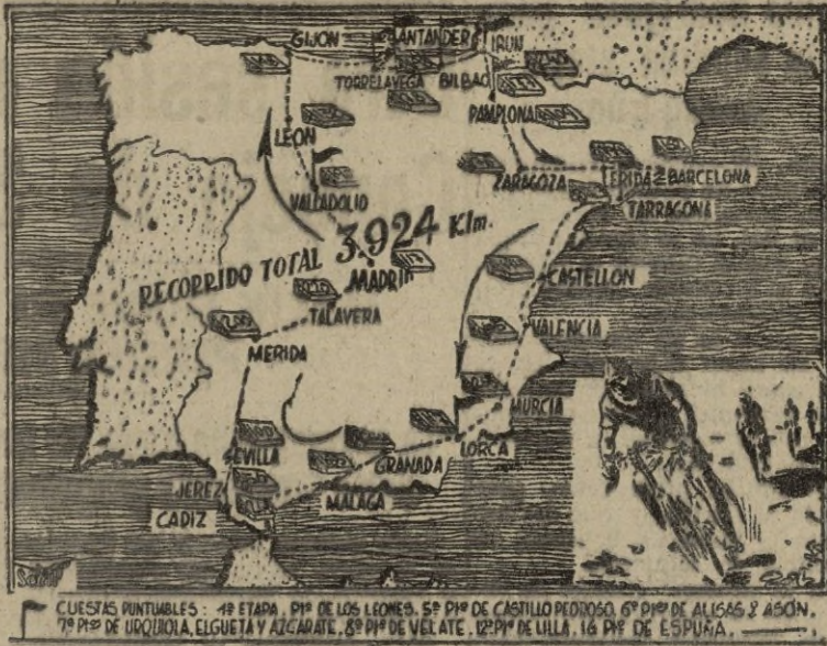
CUESTAS PUNTABLES: 1ª ETAPA: 1ª DE LOS LEONES, 5ª DE CASTILLO PEDROSO, 6ª DE ALICIAS Y ASÓN. 7ª DE URQUIOLA, ELGUETA Y AZCÁRATE. 8ª DE VELATE. 12ª DE LILLA. 16ª DE ESPAÑA.

Poco a poco va convirtiéndose nuestra prueba máxima en veterano suceso de la vida deportiva nacional. La Vuelta a España que actualmente se está desarrollando es la novena, cifra que si bien parece pequeña comparada con el certamen de Francia—el más antiguo y famoso del mundo—revela no obstante que se han vencido dificultades considerables para lograr entre nosotros el prestigio necesario a estas competiciones. Quizá los tiempos que corren sean los menos propicios a la organización de estas pruebas, y la mejor demostración está bien patente con las desagradables incidencias registradas en el país vecino hace pocas semanas, incidencias que condujeron a la retirada del equipo italiano con repercusiones en los Parlamentos de ambos países. Nuestra Vuelta a España se ha planteado este año en términos modestos, prefiriendo su celebración con no muy numerosos participantes — una cincuentena — y en modestas condiciones económicas a dejar pasar otro año en claro, como sucedió en 1949. Por eso no nos parece mal la decisión de llevar adelante la prueba con la simple concurrencia de dos equipos extranjeros, belga e italiano, aparte los varios integrados por compatriotas.