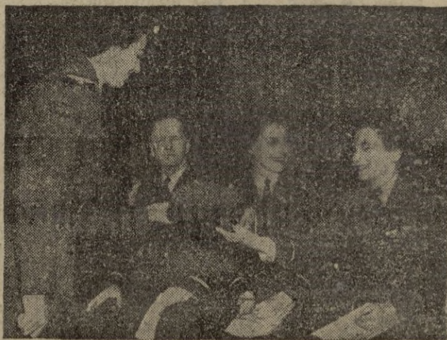
La duquesa de Gloucester durante la elección de los nuevos modelos de gorros para el personal de las Reales Fuerzas Aéreas Femeninas, que una vez elegidos, han de ser aprobados por el rey.