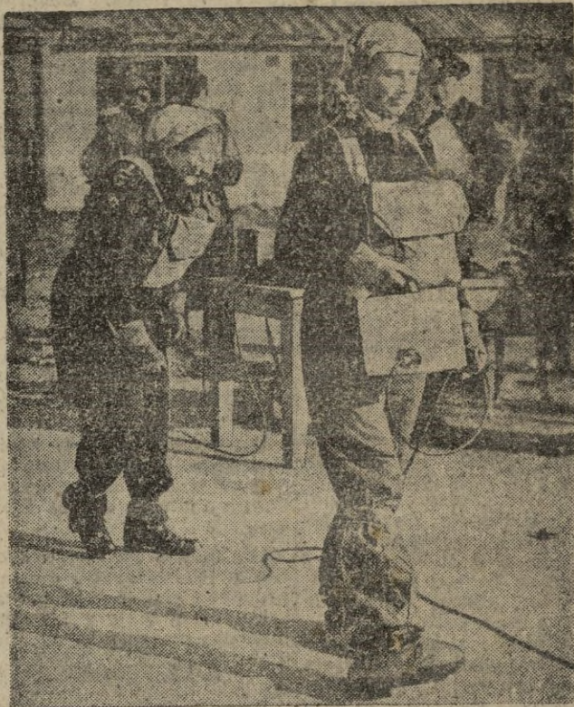
En Londres se realizan ejercicios de defensa civil contra los efectos de la radioactividad procedente de la bomba atómica. Los funcionarios de la Cruz Roja presencian una demostración de los trajes empleados por algunas voluntarias.