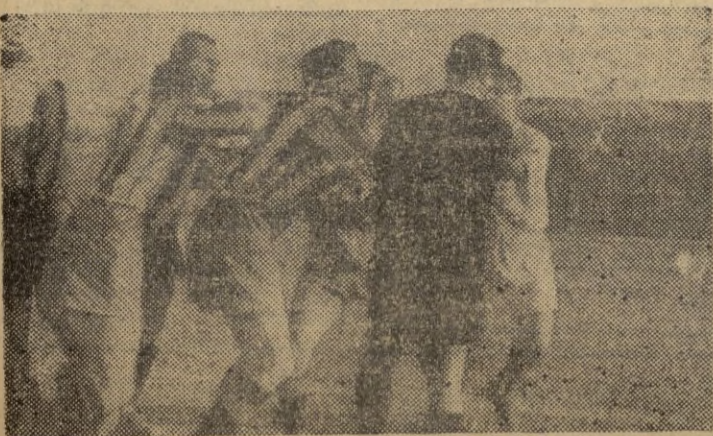
Los jugadores del Granada protestan al árbitro (Lea amplia información y nuestras habituales secciones deportivas en págs. 4, 5 y 6).