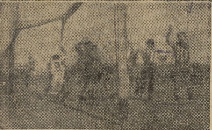
El primero y segundo gol ceuti