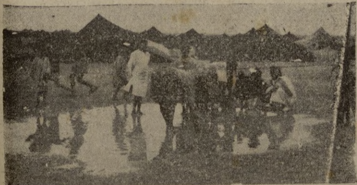
Villa Cisneros.—Para los nativos de esta zona, el agua tiene tanto valor como el oro. Así cuando de tarde en tarde, cae algún aguacero, se apresuran a recoger el preciado líquido embalsado en los desniveles del suelo antes de que la tierra reseca la trague.