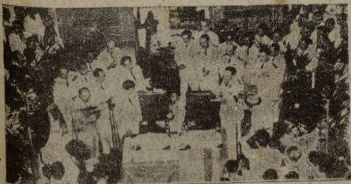
En una solemne ceremonia en Saigón, se ha celebrado la proclamación del Estado autónomo del Viet-Nam en el seno de la Unión Francesa. En el acto estuvieron presentes el emperador Bao-Dai y el alto comisario francés para las colonias, León Pignon, que firmaron los ratados de cesión de autonomía.