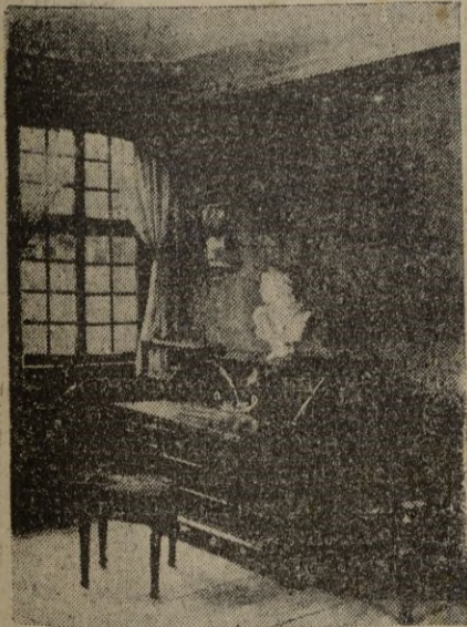
Cuarto de trabajo del poeta.

La vivacidad y la frescura de espíritu de Goethe manifestábanse, sin embargo, tan fuertemente, que olvidaba siempre la idea de la vejez. El anciano era, en resumidas cuentas, un joven. La célebre poesía escrita el 19 de febrero de 1822 y dedicada a Ondina, en que se describen con un entusiasmo juvenil los sentimientos que le embargaban, constituye una indiscutible prueba de juventud mental.