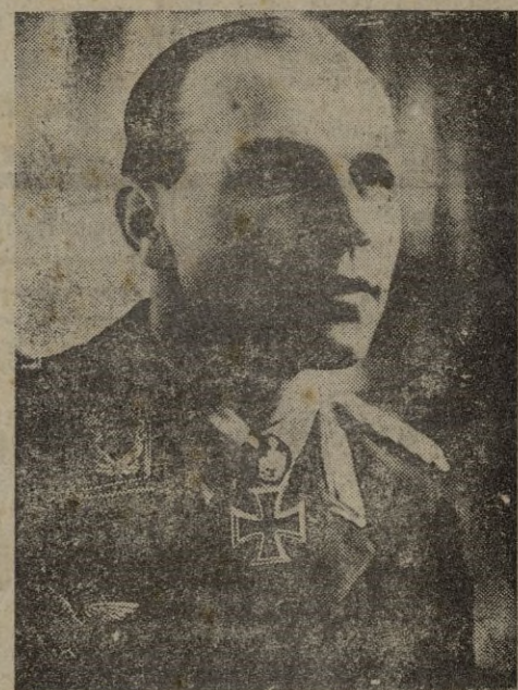
El general von Weech, de quien se dice está a la cabeza del nuevo Ejército alemán.

Las primeras unidades comenzaron a funcionar en el verano de 1948, con un núcleo formado por prisioneros repatria-