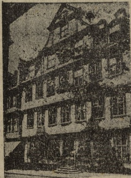
La casa de Goethe en Turingia.