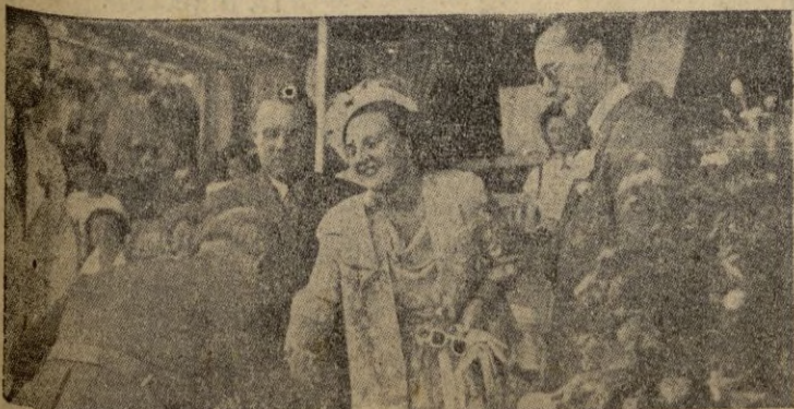
El príncipe Bernarado Leopoldo de Holanda presenta a la reina Juliana el jefe del equipo francés después de la victoria gala en las pistas ecuestres de Rotterdam.