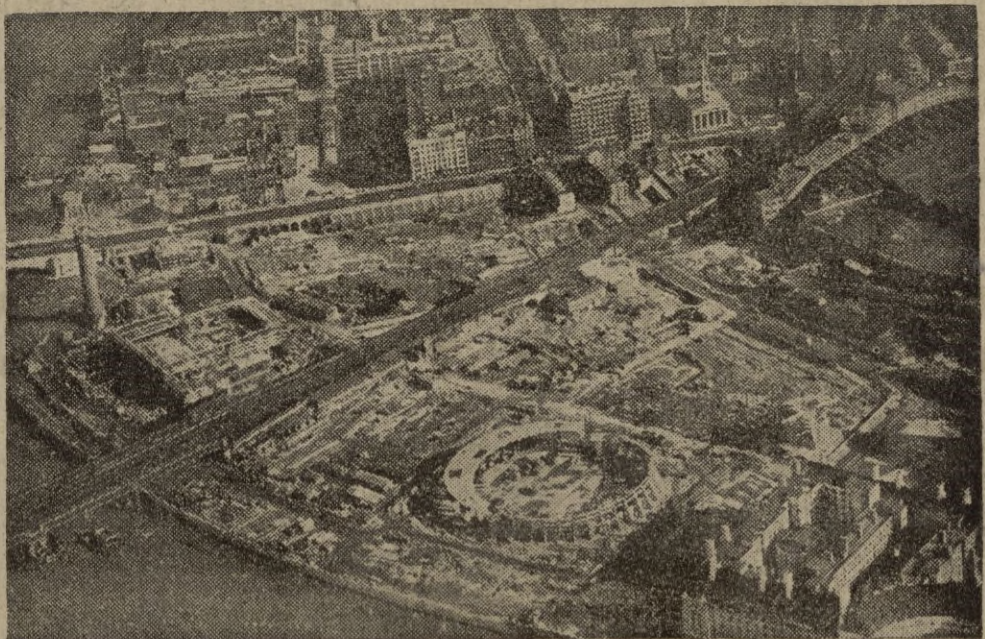
Londres prepara un Gran Festival para 1951, que no tendrá nada que envidiar a los de París. Se trata de conmemorar el aniversario de la primera Exposición Universal celebrada en Inglaterra. He aquí el emplazamiento de los edificios a construir, visto desde un avión.