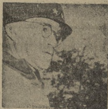
BRADLEY, jefe de los Estados Mayores conjuntos de Norteamérica

EL PRESIDENTE TAMBIEN AUTORIZA LA PRODUCCION EN GRAN ESCALA DE LAS BOMBAS HIDROGENAS