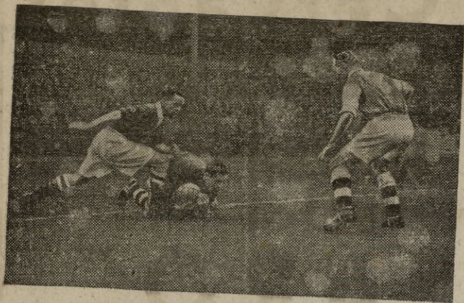
Uno de nuestros más difíciles rivales en los Campeonatos del Mundo será Inglaterra. Que aquí vemos en plena acción, atacando de firme el marco de un equipo entrenador