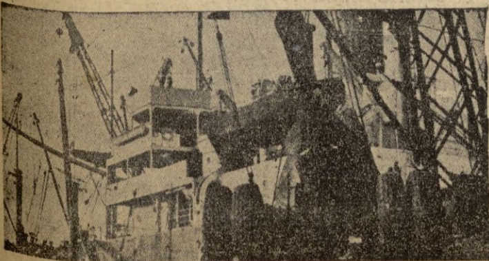
A pesar de los llamamientos lanzados por los comunistas, los muelles del puerto francés de Cheburgo ya comenzaron a recibir las armas expedidas por los Estados Unidos en virtud del acuerdo y pacto militar de defensa de Europa.